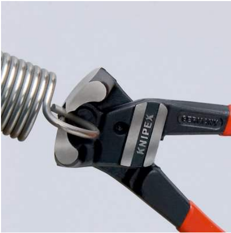
Hohe Schneidleistung: auch für Pianodraht

Nahezu bündiges Trennen von Bolzen, Nägeln usw.