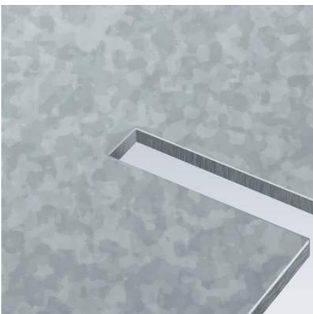
Ausklinken und Spanbrechen in einem Arbeitsgang

Technische Änderungen und Irrtümer vorbehalten