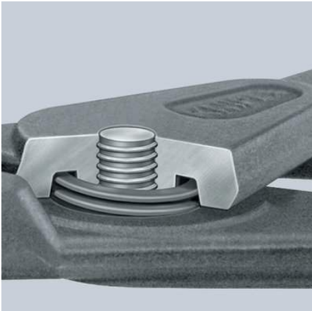
Innenliegende Feder: geschützte Lage im geschraubten Präzisionsgelenk. Keine Behinderung bei der Arbeit, keine Verschmutzung oder Verlust