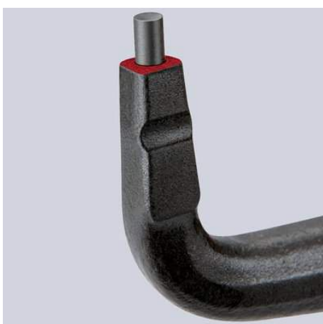
Stabile, eingesetzte Spitzen aus hochverdichtetem Federstahl

Technische Änderungen und Irrtümer vorbehalten