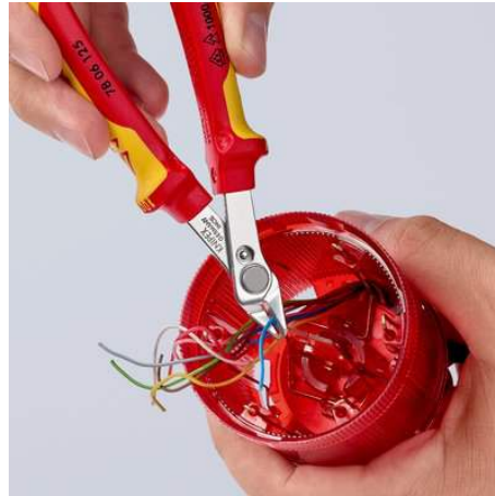
Für Einsätze unter Spannung bis 1000 V