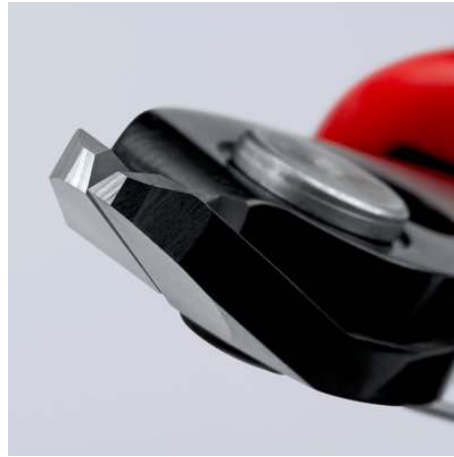
Scherschnitt mit kontrolliertem Micro-Schneidkantenversatz für lange Lebensdauer und ultrapräzisen Schnitt auch dünner Drähte