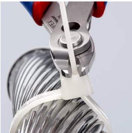
zum bündigen Schneiden, z. B. zum Einkürzen von Kabelbindern