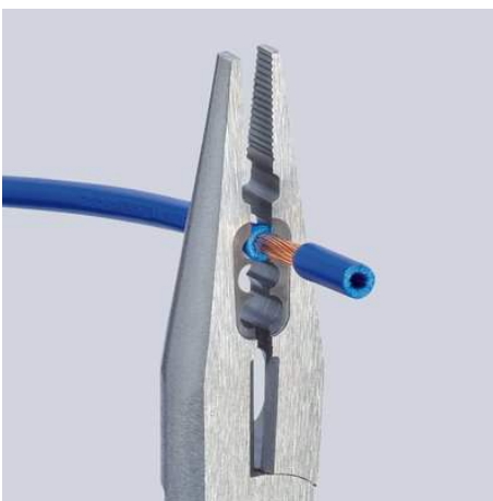
Abisolieren 0,5 - 0,75 / 1,5 / 2,5 mm 2

Technische Änderungen und Irrtümer vorbehalten