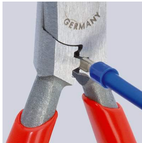
Crimpen 0,5 bis 2,5 mm 2