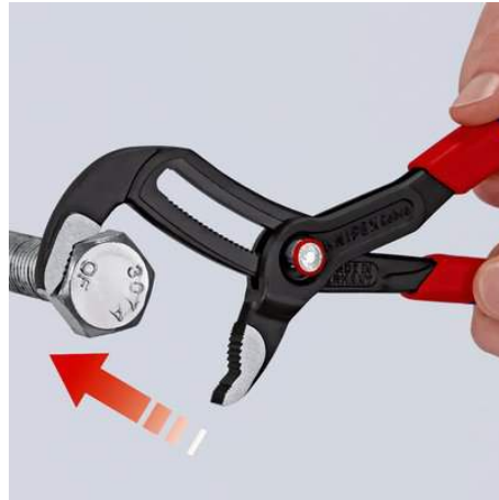
Maul anlegen - Zange einfach zuschieben