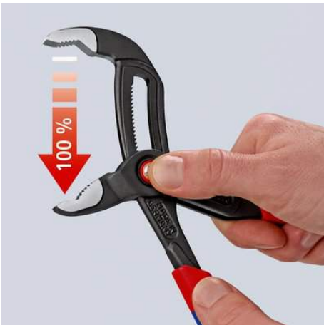
Knopf drücken - Zange vollständig öffnen