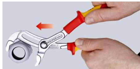
Schnelleinstellung am Werkstück ohne Druckknopfbetätigung