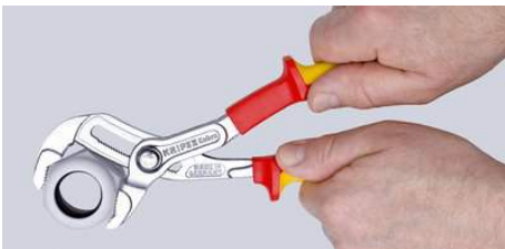
Zange einfach zuschieben!