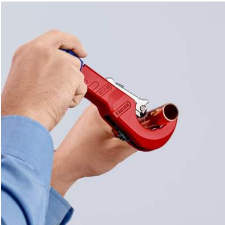
Durch Drehung schneiden und dabei mit dem ergonomischen blauen Drehknopf nachstellen ...