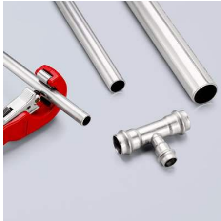
Schneller im Arbeitsalltag: Dank QuickLock-Einhandschnellfixierung rutscht das Schneidrad mit einem einzigen Daumendruck an jeden Rohrdurchmesser heran