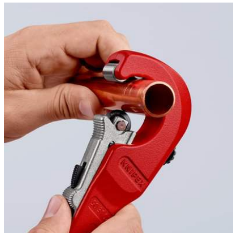
Schneidrad mit QuickLock-Einhandschnellfixierung ans Rohr schieben: schnelle Einstellung an unterschiedliche Rohrdurchmesser ...