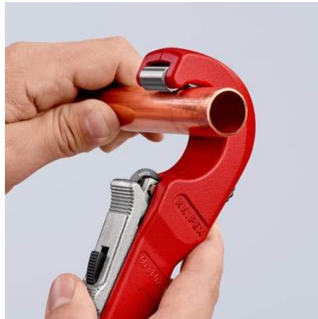
Die neue Leichtigkeit des Schneidens: geöffneten KNIPEX TubiX® Rohrschneider ansetzen ...