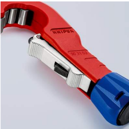
Durch die Einhandschnellfixierung kann das abgedeferte Schneidrad an den Durchmesser des Rohres herangeschoben und fixiert werden