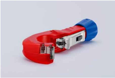
Das Schneidrad und die vier Führungsrollen laufen dank hochwertiger Nadellager beim Schneiden praktisch ohne störende Reibung – schneidet Edelstahlrohre besonders leicht