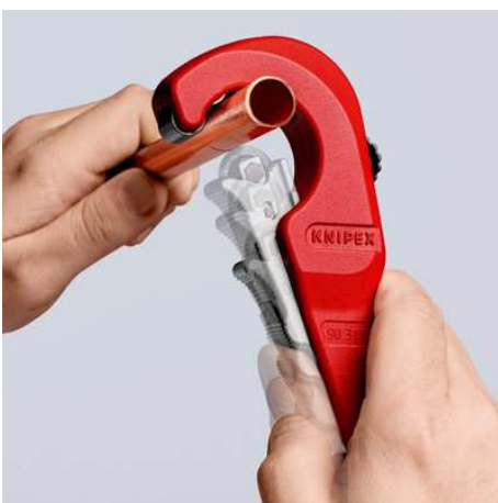
Die neue Leichtigkeit des Schneidens: geöffneten KNIPEX TubiX® Rohrschneider ansetzen ...