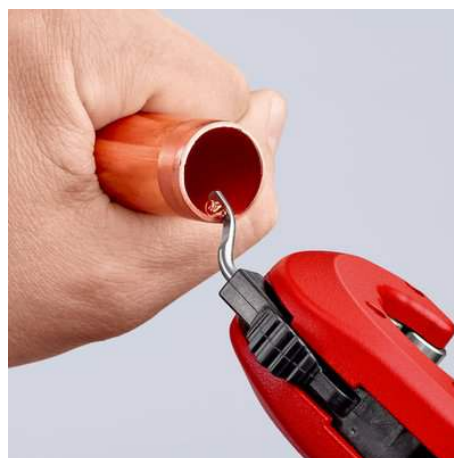
Und fertig! Bei Bedarf lässt sich die Schnittstelle mit dem ausklappbaren Entgrater glätten – mit überraschend geringem Kraftaufwand