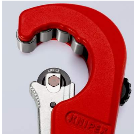
Das nadelgelagerte und abgedeferte Schneidrad aus hochwertigem Kugellagerstahl ist leicht wechselbar