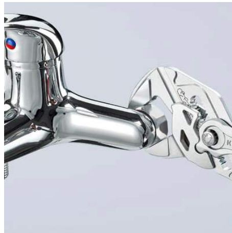
Arbeiten auf verchromter Armatur, ohne Beschädigung der Oberfläche