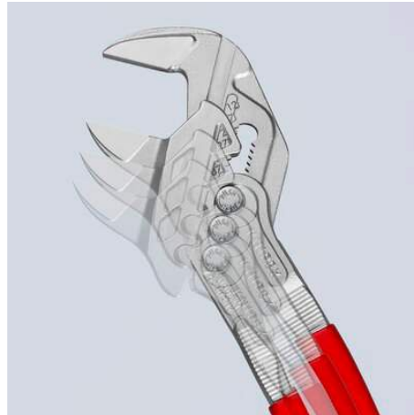
Schnelleinstellung per Knopfdruck